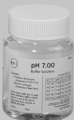
Calibrating solution pH 7