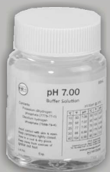
Kalibrierlösung pH 7